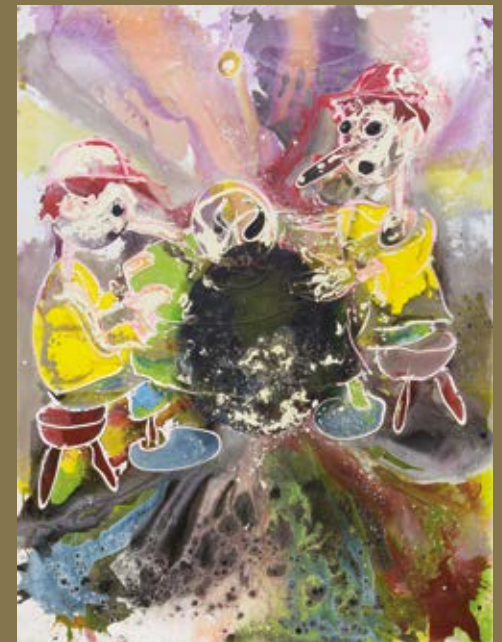
CHRISTIAN EISENBERGER, A+A = AAA, 2020, COURTESY GALERIE KRINZINGER AND THE ARTIST, FOTO: ARNAU OLIVERAS SEGUI