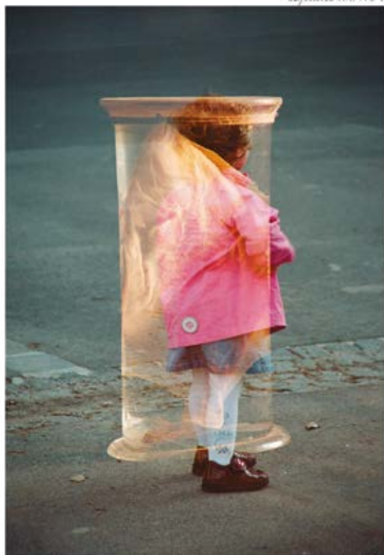
XSquie y vase de branc.