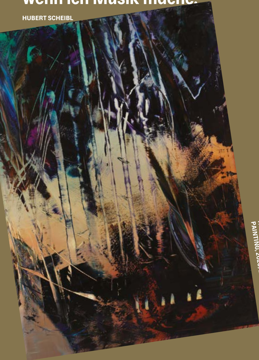
HUBERT SCHEIBL, CAGE PAINTING, 2020/2021